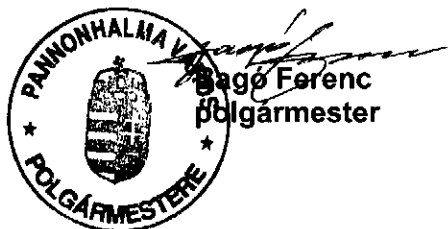
Ságó Ferenc polgármester

Testületi ülés napja: 2012. november 27.